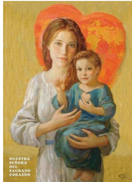
Obraz z Južnej Ameriky