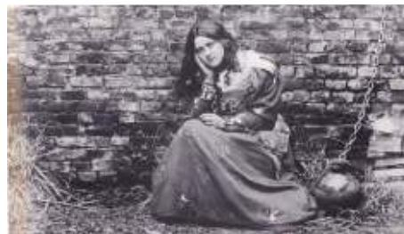
Počas rekreácie, začiatkom 1895. Terézia hrá postavu svätej Jany z Arku vo väzeni

Vyzerá to ako veľmi vyvážený denný program! Rád by som vám dal za domácu úlohu, individuálne alebo spoločne, urobiť podobný výpočet času a graf! Možno nás Pán volá k väčšiemu osobnému času na oddych a rekreáciu, aby sme mohli dať svetu a taktiež mladým ľuďom svedectvo o uvoľnenejšej komunite.